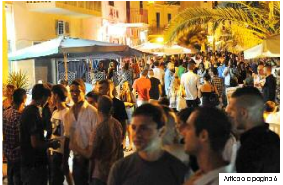
Articolo a pagina 6